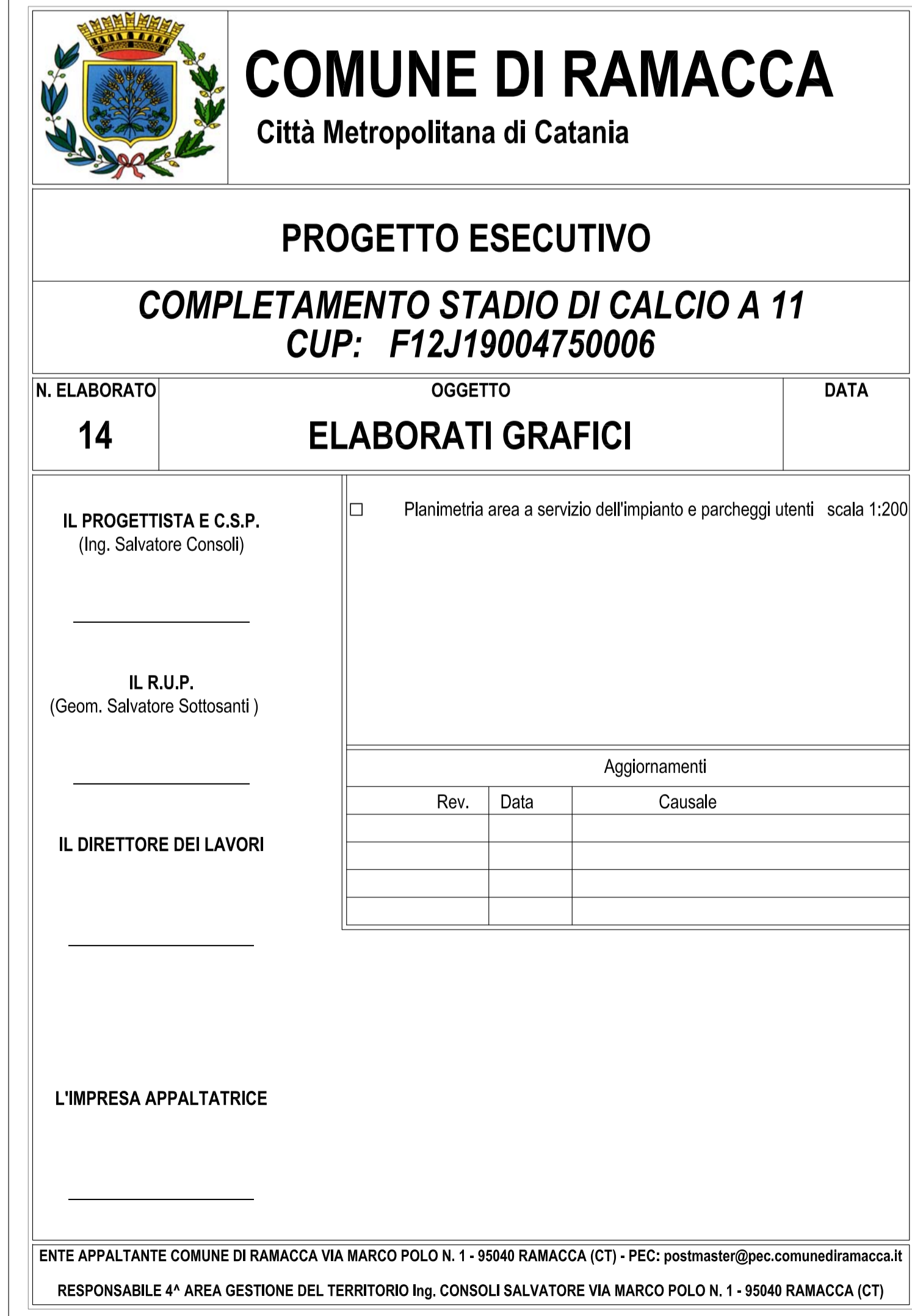
Planimetria Aree a servizio dell'impianto e parcheggi utenti scala 1:200